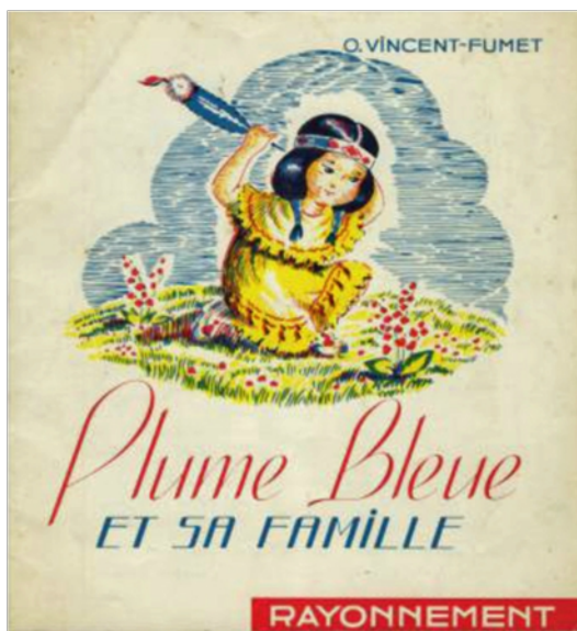
Bande dessinée d'Odette Fumet