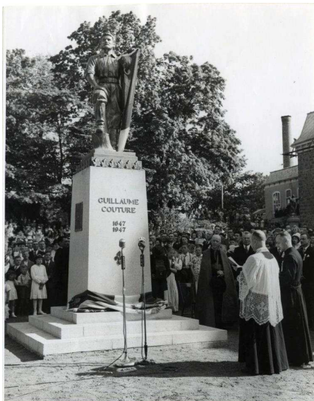
Inauguration du monument, Lauzon, 22 juin 1947

C'est le 22 juin 1947 que le monument à la mémoire de Guillaume Couture a été érigé à Lauzon, près du presbytère de l'église Saint-Joseph.